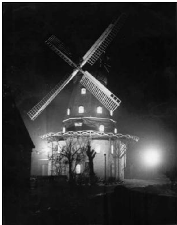
Møllen kan ses viden om både dag og nat

Ud over laugsbestyrelsen er vi så heldige at have mange møllevenner, der på frivillig basis giver en stor hånd med i forskellige aktiviteter omkring møllen: Guidere året igennem, der især i sommersæsonen tager vagter på skift i billetsalg mm.